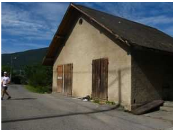
Bâtiment mis à disposition des apiculteurs à la coopérative de St Eustache

Par sa situation privilégiée (10 min du lac d'Annecy), cet emplacement offre des perspectives en terme de communication et de commercialisation particulièrement intéressantes.